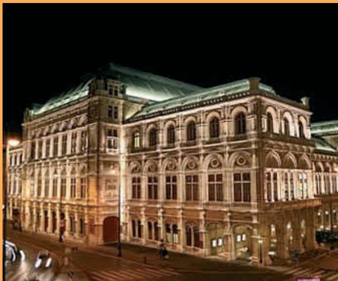
Die Wiener Staatsoper 2009 - live in Rieneck!

Internationales.Pfadfinden.Spaß.Erleben.Freundschaft