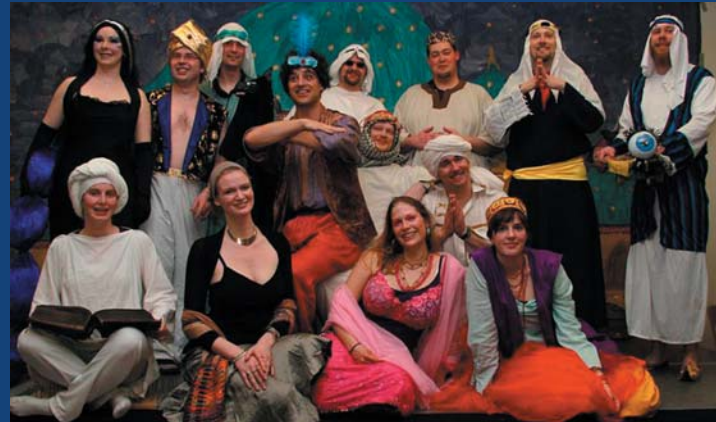
Das IMWe Team - 2008, Arabian Nights 2010 - wer wird sich wohl im Dschungel verirren?

Scouting. International. Fun. Experience. Friendship